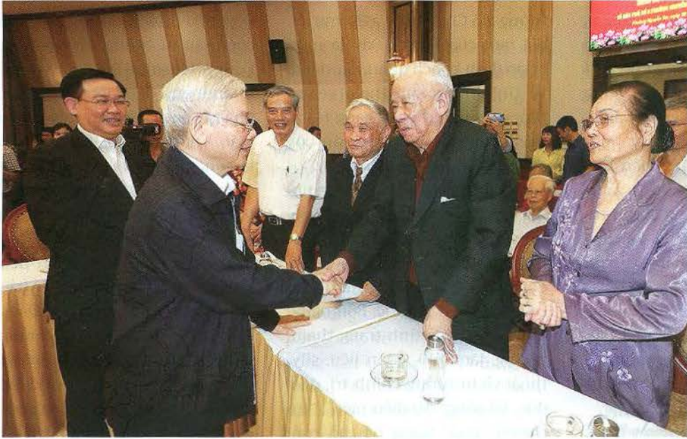
Đảng và Nhà nước ta gắn bó chặt chẽ với nhân dân, phục vụ nhân dân và chịu sự giám sát của nhân dân (Trong ảnh: Tổng Bí thư Nguyễn Phú Trọng với cử tri Tổ dân phố số 8, phường Nguyễn Du tại Hội nghị lấy ý kiến nhận xét và tin nhiệm cử tri nơi cư trú đối với người ứng cử đại biểu Quốc hội khoá XV, nhiệm kỳ 2021-2026 (tháng 3-2021)).

lý luận đó chỉ đặt nền móng cho môn khoa học mà những người xã hội chủ nghĩa cần phải phát triển hơn nữa về mọi mặt, nếu họ không muốn trở thành lạc hậu đối với cuộc sống" (1) .