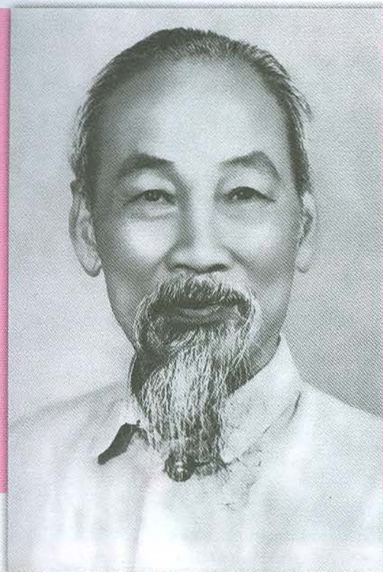
Hồ Chủ tịch sống mãi trong sự nghiệp chúng ta.