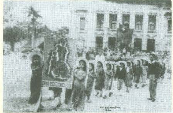
Các em Nhi đồng đi vận động ngày cứu đói 11/10/1945 Trung tâm Lưu trữ quốc gia III. Phong Nghệ sĩ nhiếp ảnh Nguyễn Bá Khoản, SLT 119 - C4

Cách mạng tháng Tám thành công, nước Việt Nam Dân chủ Cộng hòa ra đời, nhân dân được sống trong hòa bình, được hưởng quyền tự do, độc lập, song đất nước đứng trước muôn vàn khó khăn, thử thách: thù trong, giặc ngoài đe dọa chính quyền non trẻ vừa mới giành được; tiềm lực mọi mặt của đất nước còn non yếu; kinh tế nông nghiệp lạc hậu; thủ công nghiệp không phát triển được; hàng hóa khan hiếm; giá cả tăng vọt; đời sống nhân dân gặp nhiều khó khăn; chính sách cai trị của Pháp và Nhật đã làm cho hơn 2 triệu đồng bào nước ta chết đói; tiếp đến thiên tai mất mùa xảy ra liên miên; thiếu lương thực làm cho nạn đói càng trở