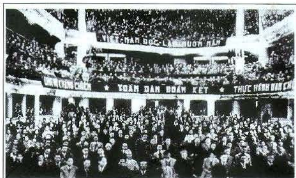
Toàn cảnh Kỳ họp thứ nhất Quốc hội Khóa I, ngày 02/3/1946 tại Nhà hát lớn Hà Nội.