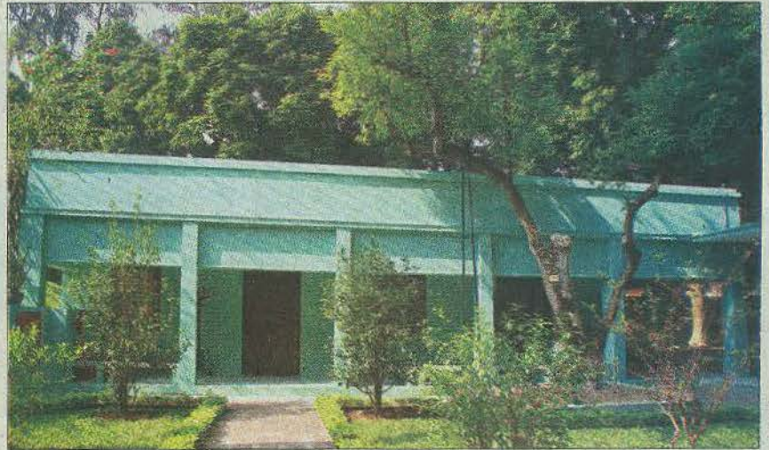
Nhà 67 nằm phía sau nhà sàn-nơi Chủ tịch Hồ Chí Minh làm việc trong thời gian đế quốc Mỹ leo thang đánh phá miền Bắc (1967-1969), cũng là nơi Người dưỡng bệnh và qua đời.