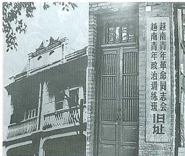
Trụ sở Hội Việt Nam Cách mạng Thanh niên và nơi ra báo Thanh niên ở Quảng Châu, Trung Quốc.

Từ đầu năm 1925, Bác Hồ đã chọn nhiều thanh niên yêu nước được gửi từ Việt Nam sang để huấn luyện chính trị, đào tạo họ thành những cán bộ cách mạng, rồi cho về nước truyền bá chủ nghĩa Mác - Lênin. Tháng 6/1925, Người lập Hội Việt Nam Cách mạng Thanh niên (đây