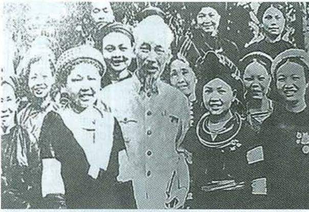
Bác Hồ với đồng bào các dân tộc (Ảnh tư liệu).