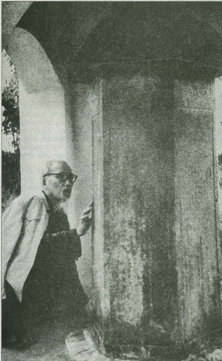
Chủ tịch Hồ Chí Minh về thăm Côn Sơn (tháng 2-1965).

➤ Chưa có thống kê cụ thể nhưng nhiều nhà nghiên cứu đã cho rằng, “dân” là một trong những từ được Bác Hồ nhắc đến nhiều nhất trong các bài viết, bài nói lúc sinh thời. Dân là mệnh đề thường trực trong suy nghĩ và hành động của vị lãnh tụ vĩ đại. Bản Di chúc lịch sử cũng thấm đẫm tinh thần vì nhân dân của Bác.