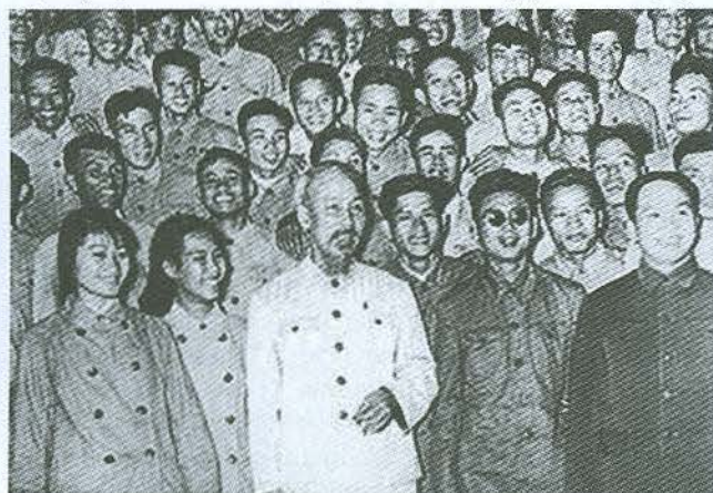
Chủ tịch Hồ Chí Minh chụp ảnh với đại biểu quân đội, thương binh và quân nhân phục viên sau buổi gặp tại Phủ Chủ tịch, 29/1/1957.

... Như thế thì đồng bào mỗi xã được thỏa mãn lòng ao ước báo đáp anh em thương binh, mà anh em thương binh thì được yên ổn về vật chất và vui vẻ về tinh thần và có dịp tham gia hoạt động có ích cho xã hội".