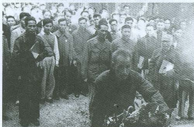
Bác Hồ dâng hương, đặt vòng hoa trước Tượng đài liệt sỹ tại Thủ đô Hà Nội (31/12/1954).