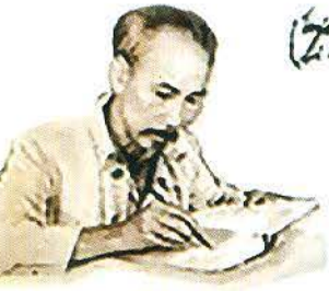
Bác Hồ viết di chúc

(Những nội dung cốt lõi của Di chúc Chủ tịch Hồ Chí Minh)