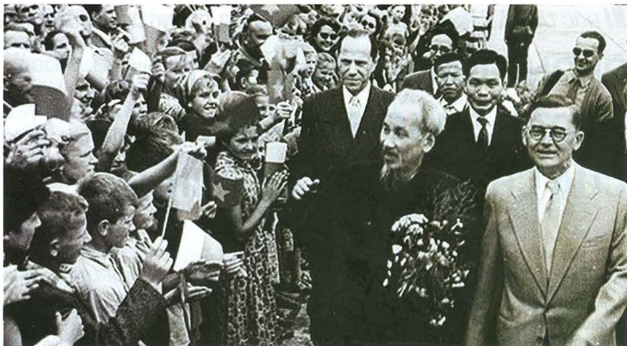
Nhân dân Ba Lan nồng nhiệt đón chào Chủ tịch Hồ Chí Minh và Đoàn đại biểu Chính phủ Việt Nam Dân chủ Cộng hòa, tháng 7/1957.

hội, thấy triết lý khoan giản an lạc của Phật Hoàng Trần Nhân Tông, thấy kế sách khoan thứ sức dân của Hưng Đạo Đại Vương Trần Quốc Tuấn, thấy đạo nghĩa khoan dung, vị tha của Nguyễn Trãi, Quang Trung, v.v... Chính truyền thống khoan hòa, hiện thân của đức Chí Nhân của dân tộc Việt Nam, là mạch nguồn chủ yếu dung dưỡng nên phong cách khoan dung, độ lượng Hồ Chí Minh.