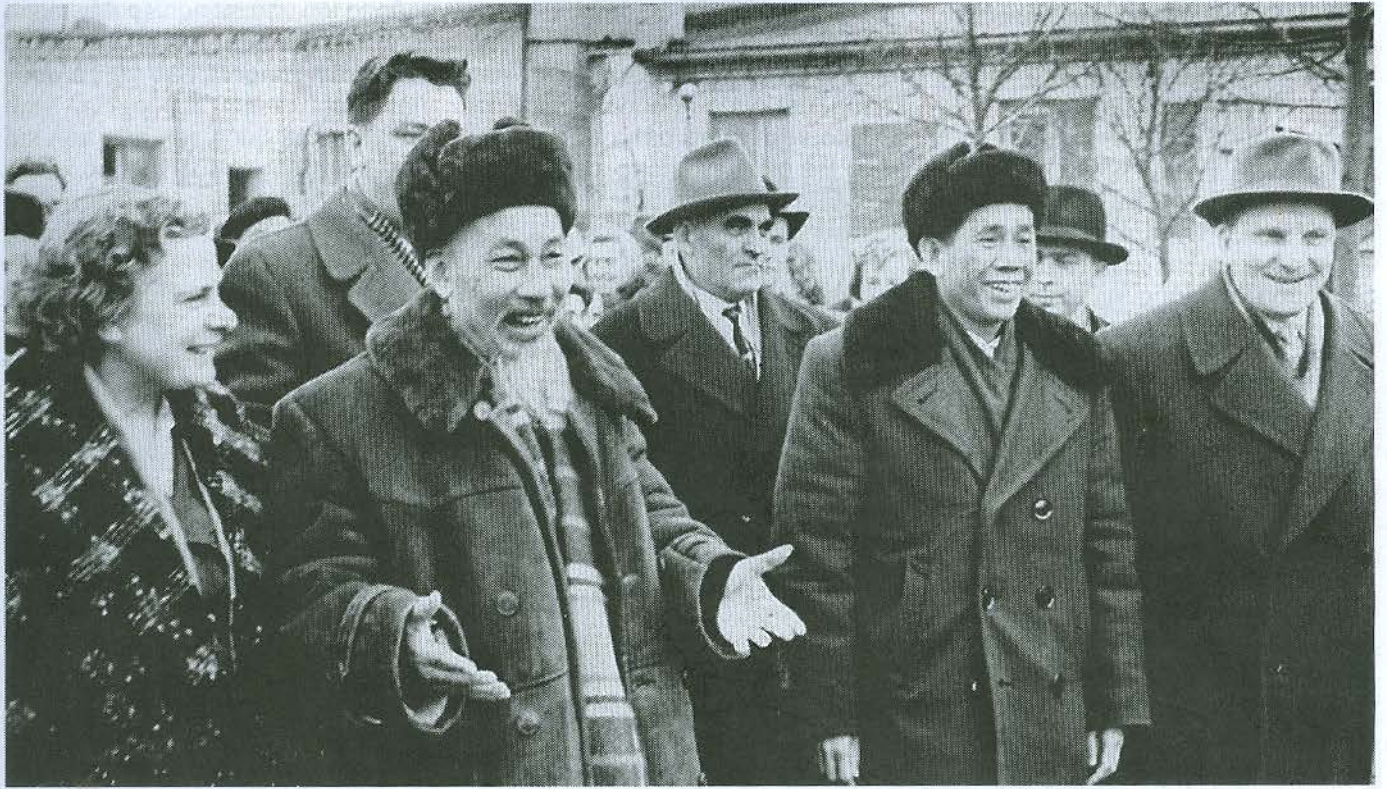
Chủ tịch Hồ Chí Minh cùng Bí thư thứ nhất Lê Duẩn dự Đại hội lần thứ XXII của Đảng Cộng sản Liên Xô, năm 1961