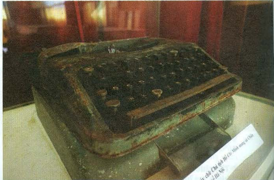
Chiếc máy chữ đầu tiên Chủ tịch Hồ Chí Minh mang từ ATK về Hà Nội.